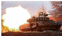
ウクライナと国境を接する西部地域から発砲するロシア軍の戦車＝3月19日