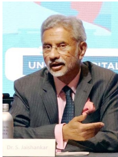
初めて開催された「ライシナ対話」の東京会合で講演するインドのジャイシナカル外相 = 3月7日、東京都港区