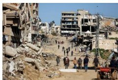
イスラエル軍の攻撃で破壊された廃墟の中を歩く人々＝3月20日、パレスチナ自治区ガザ