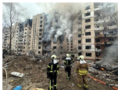
ロシアのミサイル攻撃で損壊したウクライナ首都キーウの集合住宅＝1月