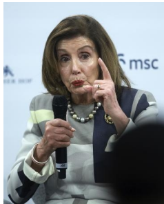
ミュンヘン安全保障会議で発言するベロシ元米下院議長 = 2月17日