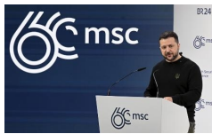
ウクライナのゼレンスキー大統領 = 2月17日