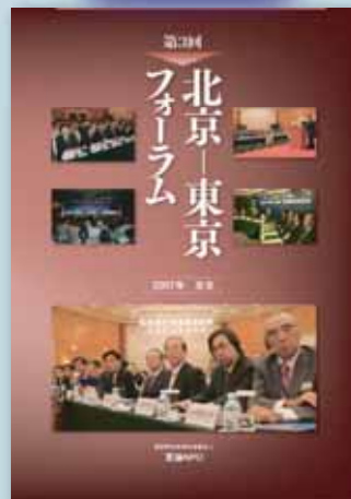
第3回 北京-東京フォーラム A4判・188頁・定価2100円(税込)